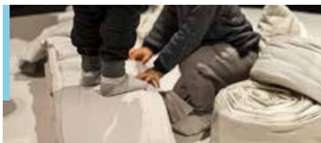
L'éloge du blanc © Fanny Trichet

Cette année dans le cadre des semaines de la petite enfance, des spectacles vous sont proposés sur les secteurs de Concarneau, Melgven et Trégunc.